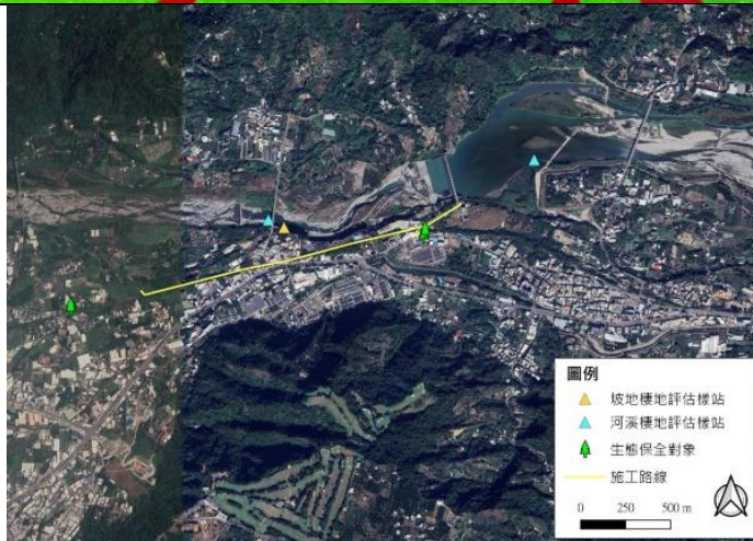
生態檢核作業之相關點位圖