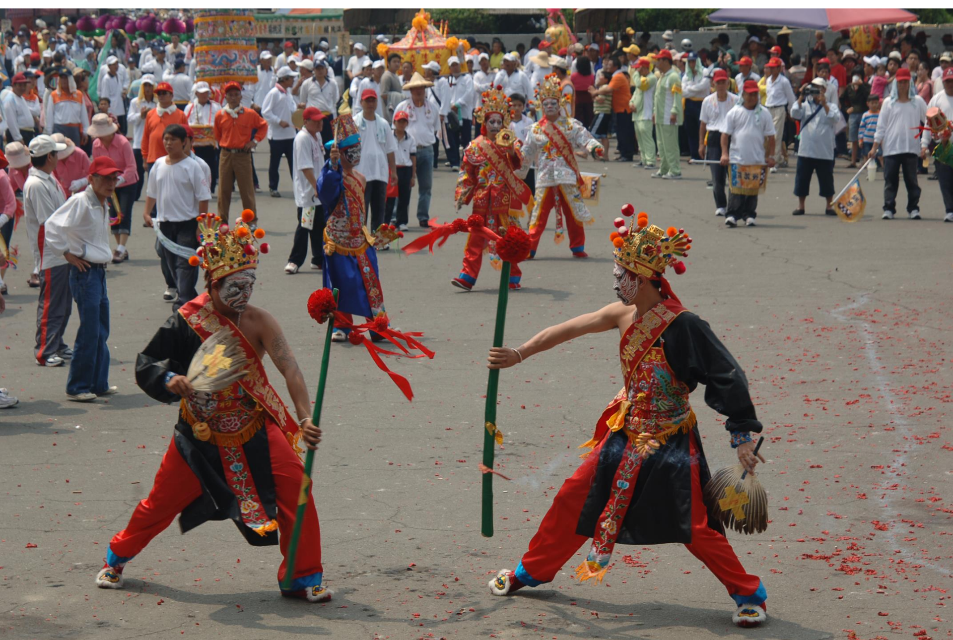
茄萣賜福宮八家將拜廟