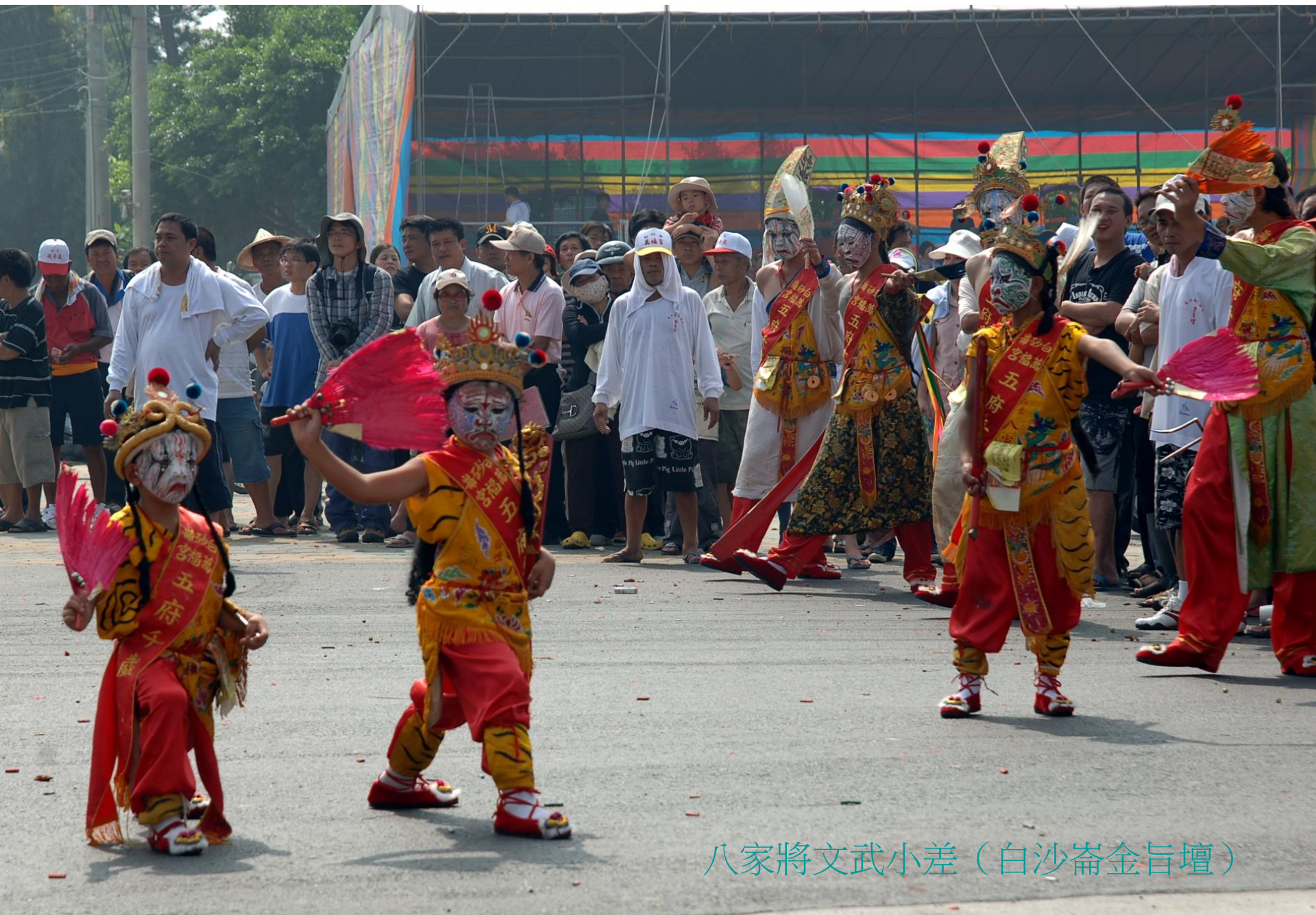
八家將文武小差（白沙崙金旨壇）