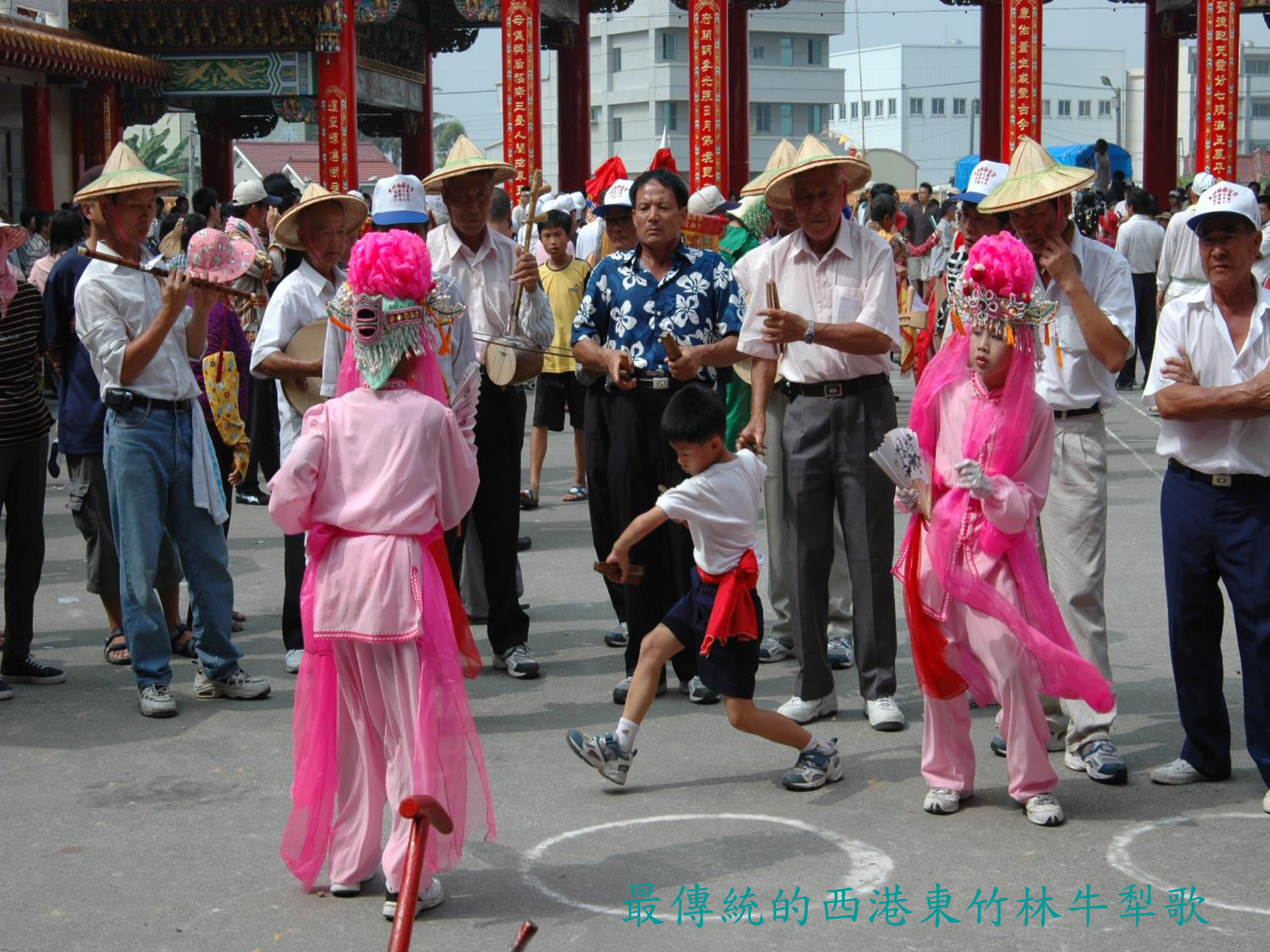
最傳統的西港東竹林牛犁歌