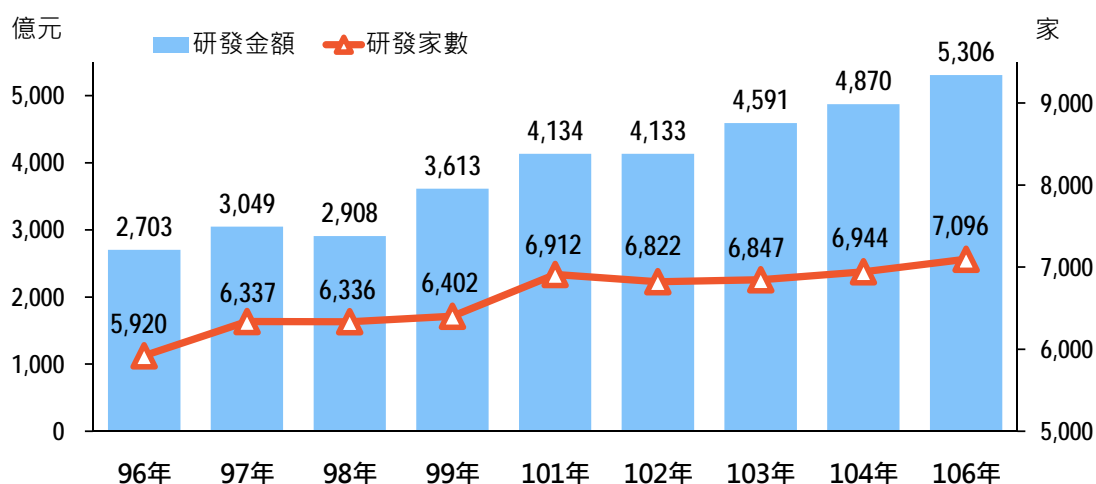
研究發展家數及金額

依支出項目分，106 年因研究發展所需之人事費、業務費、維護費、材料費等經常支出 4,741 億元，占 89.3%，較 104 年增加 290 億元或平均年增 3.2%；為研究發展而購置的機械設備、土地及建築物、交通及運輸設備、資訊設備等資本支出 565 億元，占 10.7%，較 104 年增加 146 億元或平均年增 16.1%。