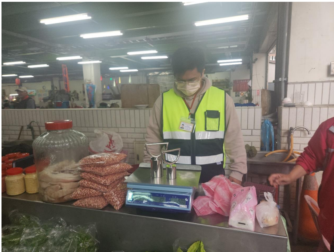
113年12月27日花蓮縣光復鄉第一市場磅秤(電子秤)檢查