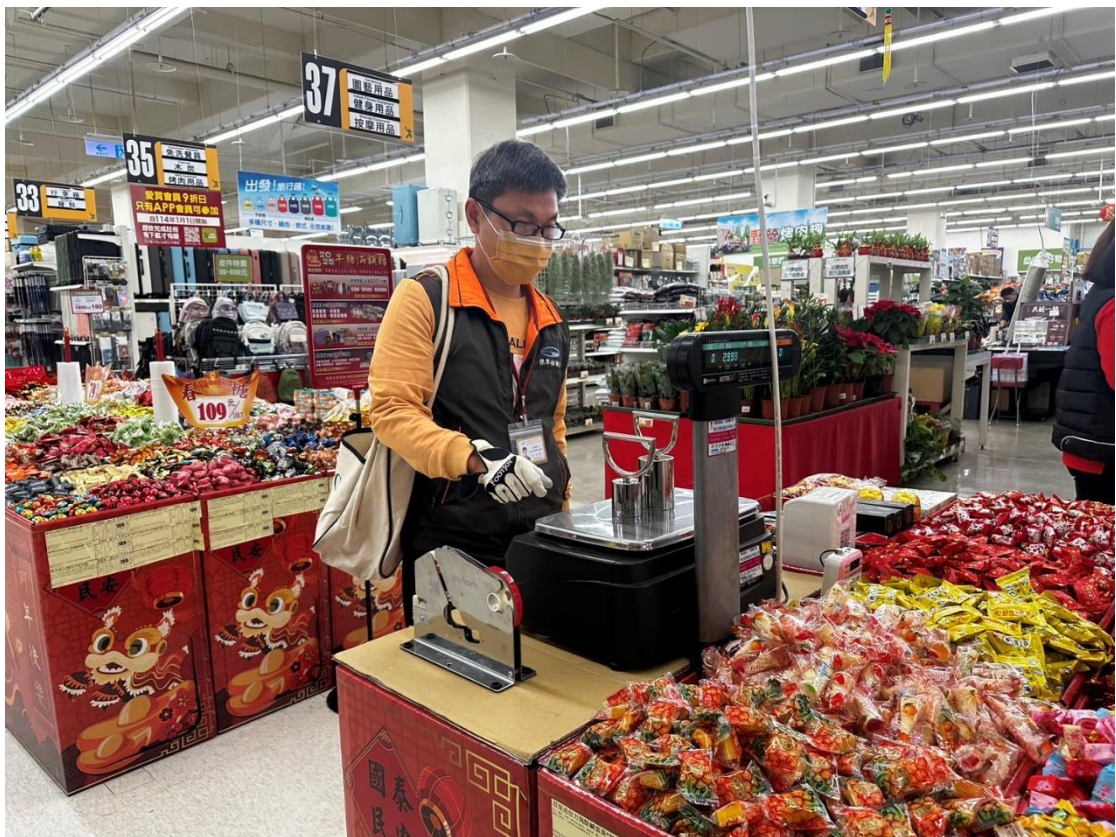
113年12月26日花蓮縣花蓮市遠百愛買超市磅秤(電子秤)檢查