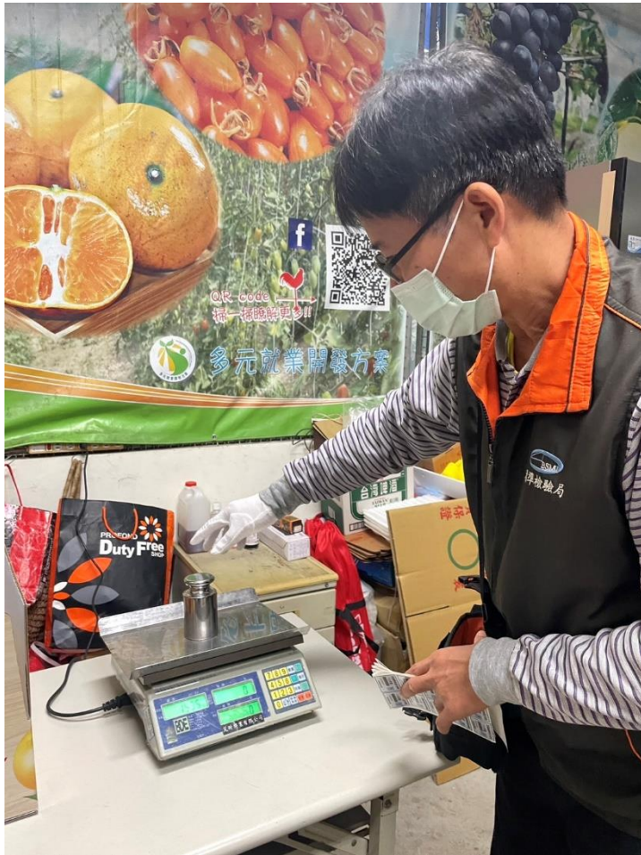
113年12月31日臺中市東勢第一公有零售市場磅秤(電子秤)檢查