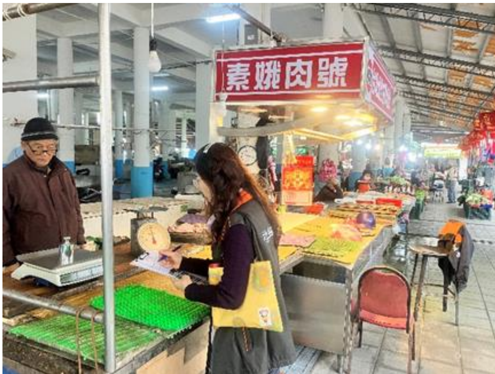
114年1月2日宜蘭縣蘇澳鎮中原公有零售市場豬肉攤商磅秤(電子秤)檢查