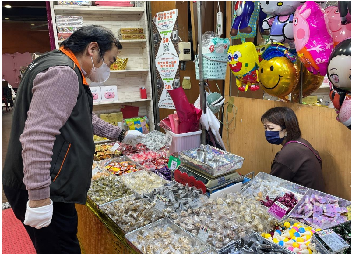
114年1月3日三鳳中街磅秤(電子秤)檢查