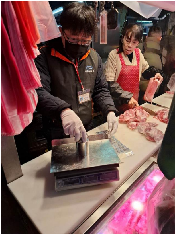
114年1月2日新竹縣竹東鎮中央市場磅秤(電子秤)檢查