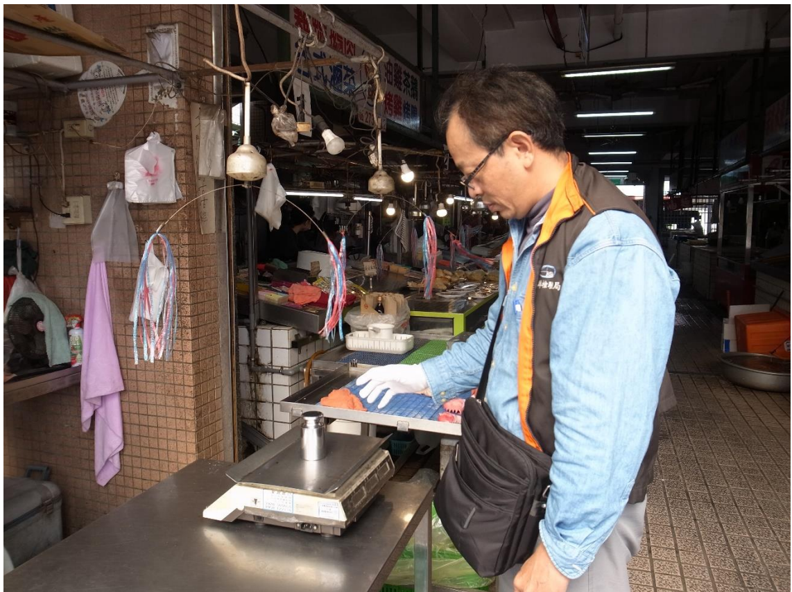
113年12月25日南投縣名間鄉公有零售市場磅秤(電子秤)檢查