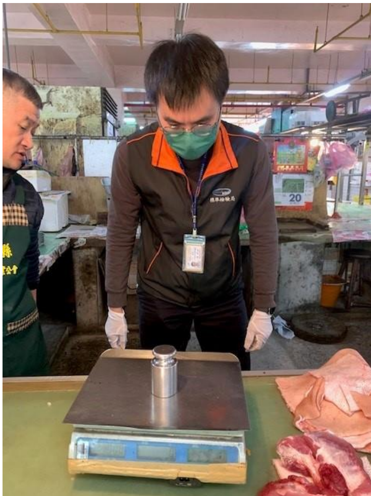
114年1月3日苗栗縣北苗公有零售市場磅秤(電子秤)檢查