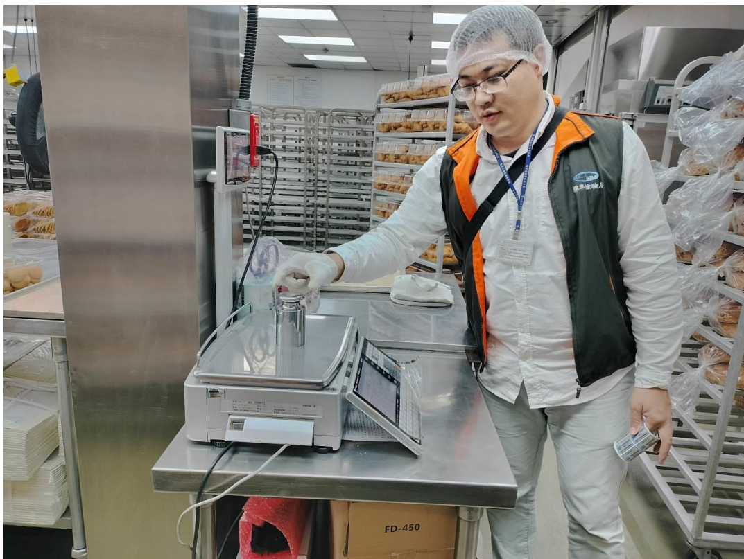
114年1月2日桃園市中壢好市多磅秤(電子秤)檢查