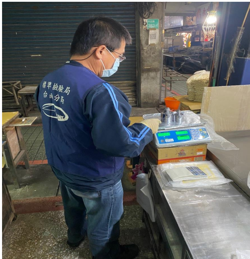
114年1月3日臺南市新化市場磅秤(電子秤)檢查