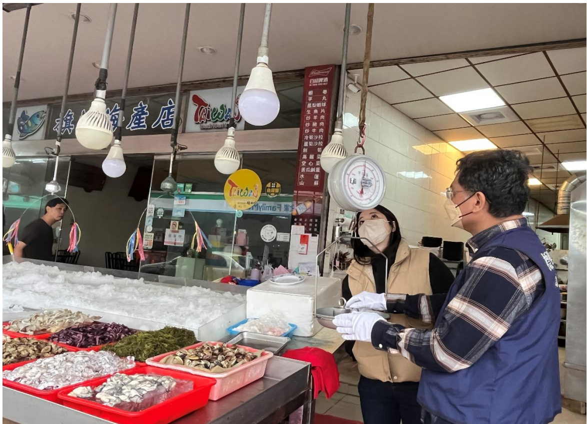
114年1月3日高雄市天天新黃昏市場磅秤(機械秤)檢查