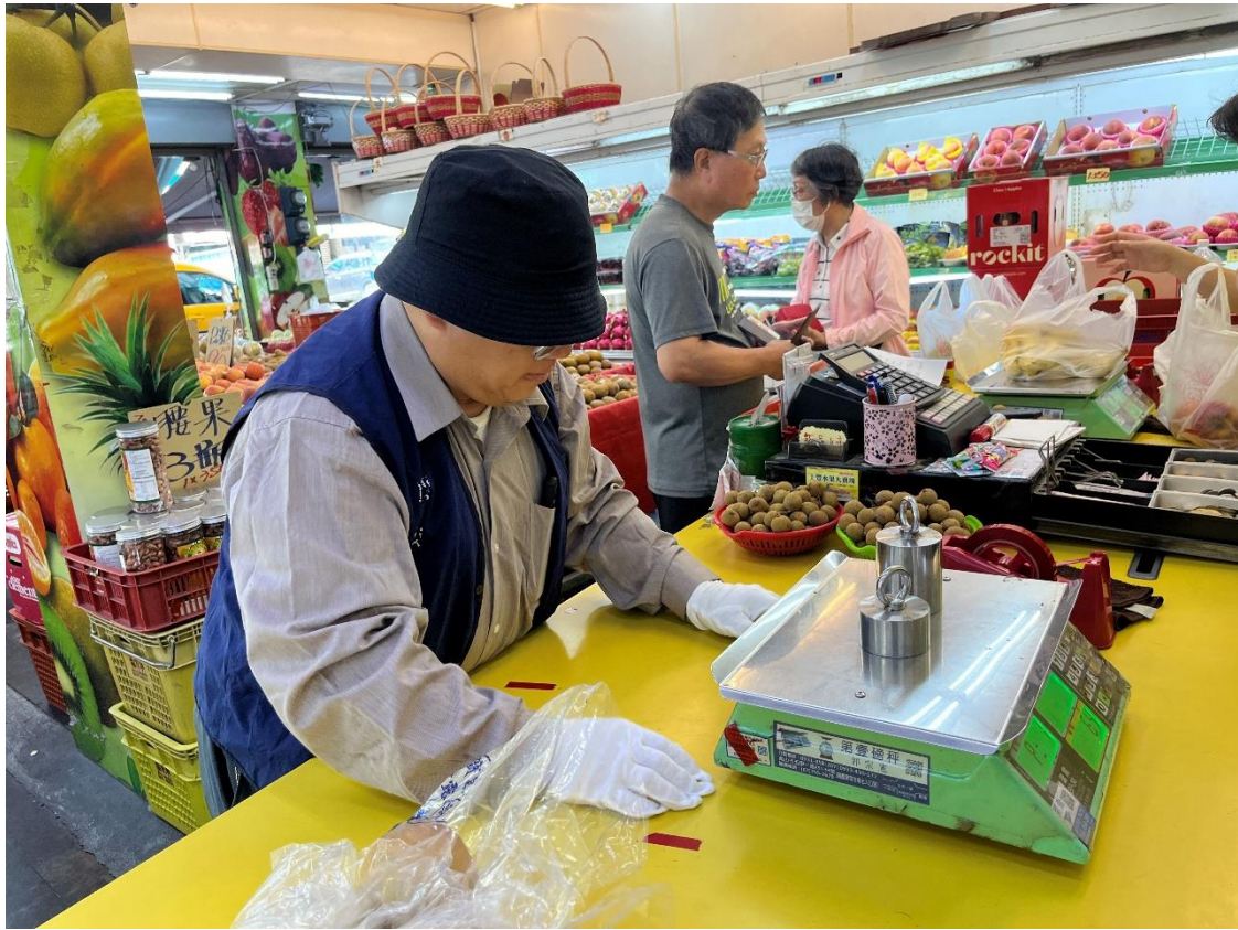
114年1月3日高雄市永松海青果行磅秤(電子秤)檢查