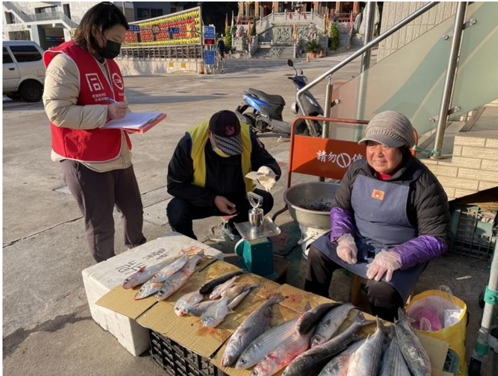
114年1月2日連江縣介壽獅子市場水產零售攤販磅秤(機械秤)檢查