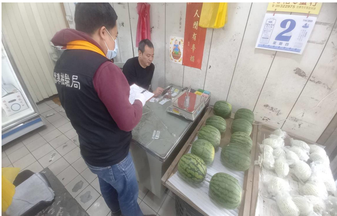
114年1月2日臺東市中央市場磅秤(電子秤)檢查