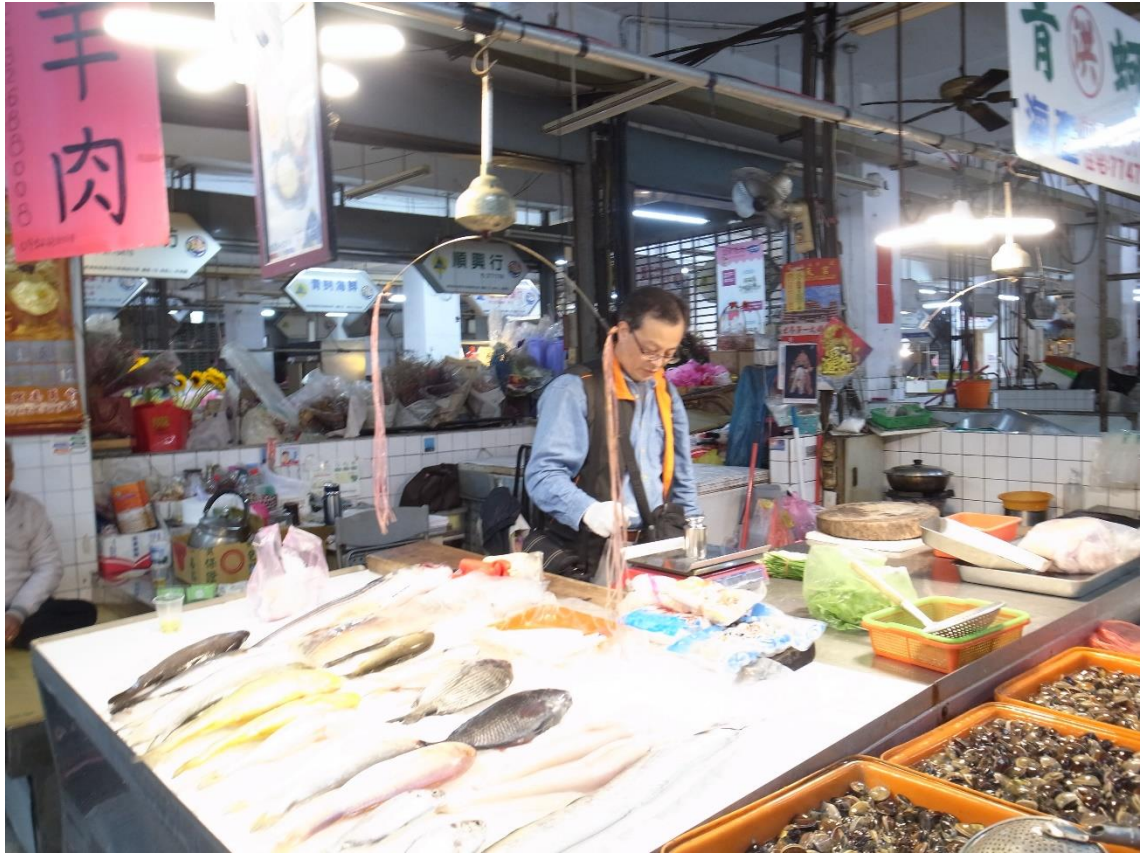
113年12月25日臺中市水里公有第一零售市場磅秤(電子秤)檢查