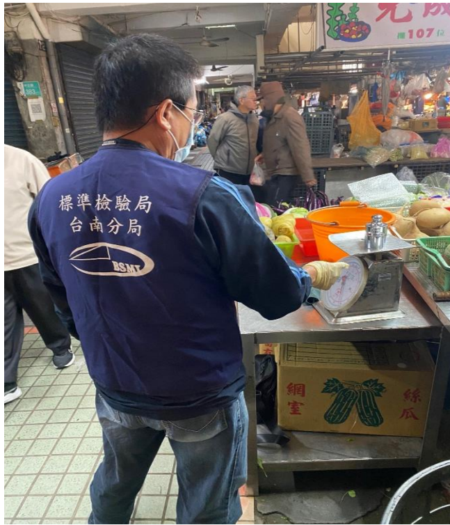
114年1月2日臺南市麻豆市場磅秤(機械秤)檢查