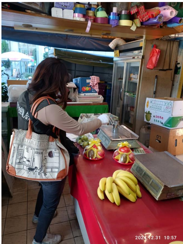
113年12月31日臺中市鉉澄水果行磅秤(電子秤)檢查