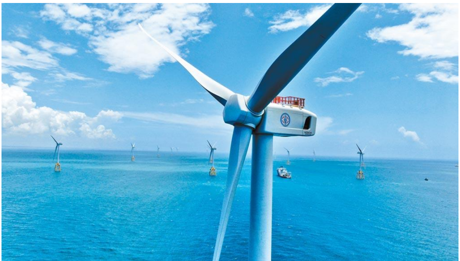
▲ 台電公司--離岸風電一期完工

(一)協助台電公司持續推動「太陽光電第四期計畫」、「太陽光電第五期計畫」、「風力發電第五期計畫」、「宜蘭仁澤地熱發電計畫」、「全台小水力發電第一期計畫」、「離岸風力發電第一期計畫」、「離岸風力發電第二期計畫」、「綠能第一期計畫」等再生能源發電計畫。