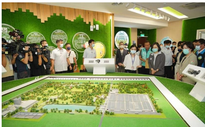
▲ 蔡英文總統視察台糖公司東海豐農業循環園區