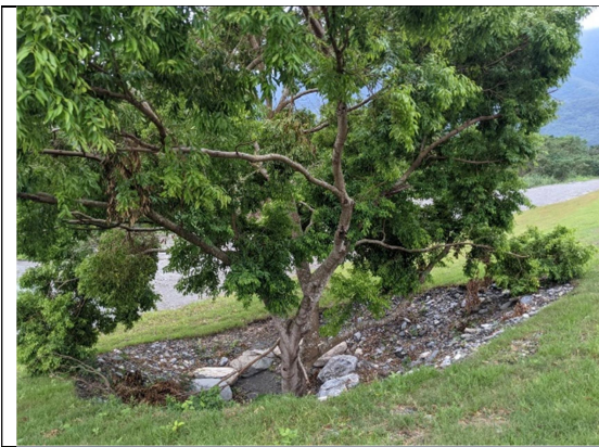
圖7、施工前重要原生喬木原地保留，並調整施工方式，配合保全樹穴。