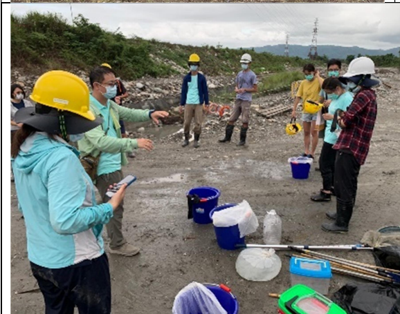
圖9、新舊水圳交接，生態團隊協助進行水域生物移置工作。