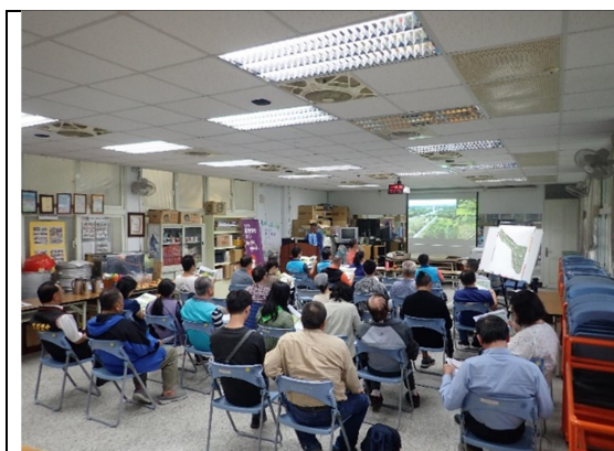
圖1、辦理民眾參與工作坊，說明生態調查成果及特色，並研議保全措施落實生態檢核並回饋至工程設計。