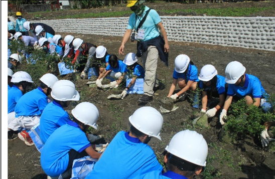
圖5、搭配植樹節及工程欲復育原生種植物臺灣火刺木，辦理植樹教育訓練暨活動，邀請相關單位及在地居民一同共學。