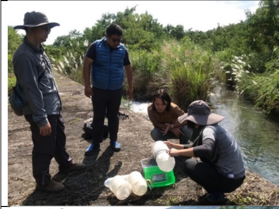
圖2、全生命週期皆辦裡生物資源調查，紀錄關注物種狀況。