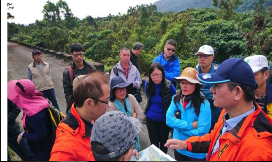
圖3、與林務局合作，於工程施工區域進行外來入侵種植物移除、生態植被復育、原生種植物復育