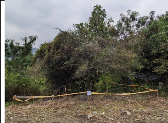
圖8、施工整地期間發現重要原生種植物臺灣火刺木，立即進行保留並配合調整設計圖。