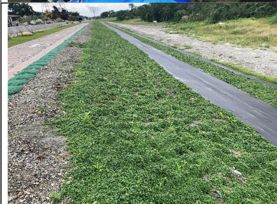
圖6、採用越橘葉蔓榕試驗創造生態綠堤，並降低維護管理成本。