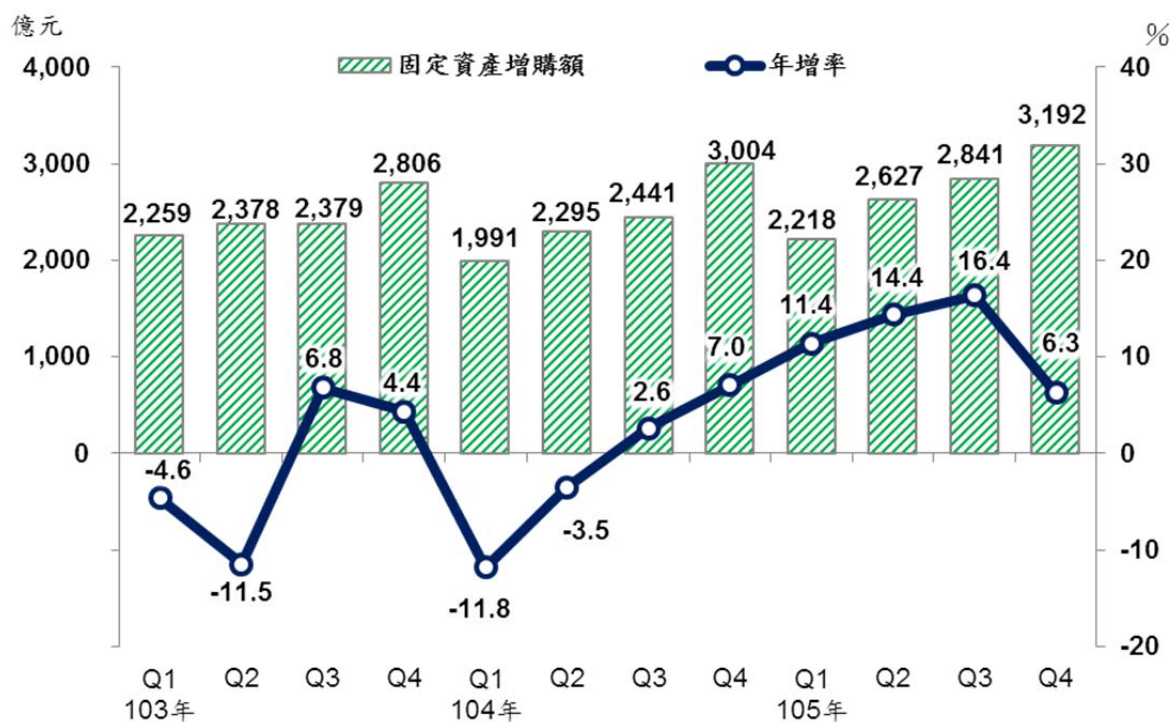
製造業近年各季固定資產增購額及年增率