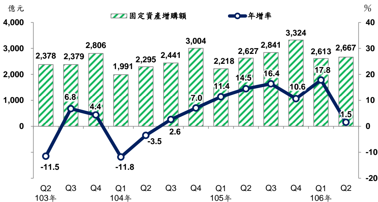
製造業固定資產增購金額及年增率

106年第2季製造業國內固定資產增購2,667億元，較上季增2.0%，較上年同季增1.5%，為連續8季正成長，惟因去年同季有部分業者逢設備裝機期，比較基數高，致年增幅度較緩。按固定資產型態分，以機械設備增購2,331億元(占87.4%)居首，年增2.9%，房屋及營建工程308億元(占11.5%)居次，年減9.1%，交通及運輸設備28億元，年增29.2%。累計上半年固定資產增購5,280億元，較上年同期年增9.0%。