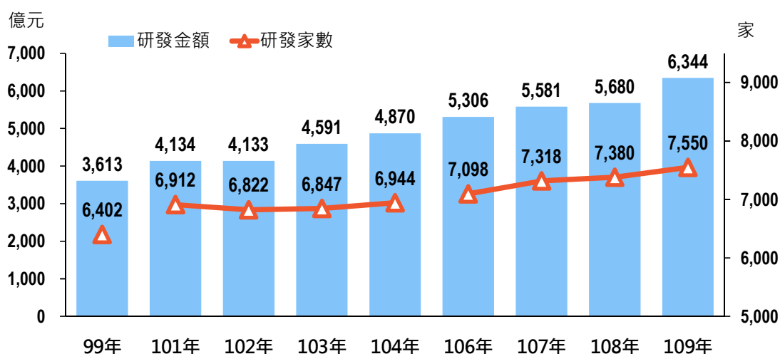
研究發展家數及金額概況

依支出項目分，109 年因研究發展所需之人事費、業務費、維護費、材料費等經常支出 5,755 億元，占 90.7%，較 108 年增加 541 億元或年增 10.4%；為研究發展而購置的機械設備、土地及建築物、交通及運輸設備、資訊設備等資本支出 590 億元，占 9.3%，較 108 年增加 124 億元或年增 26.6%。