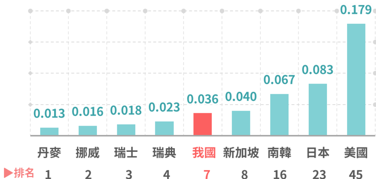
圖1. 2021年主要國家性別不平等指數(GII)與排名

資料來源：聯合國開發計畫署（UNDP）「Human Development Report 2021-22」，行政院性別平等處「2023年性別圖像」。