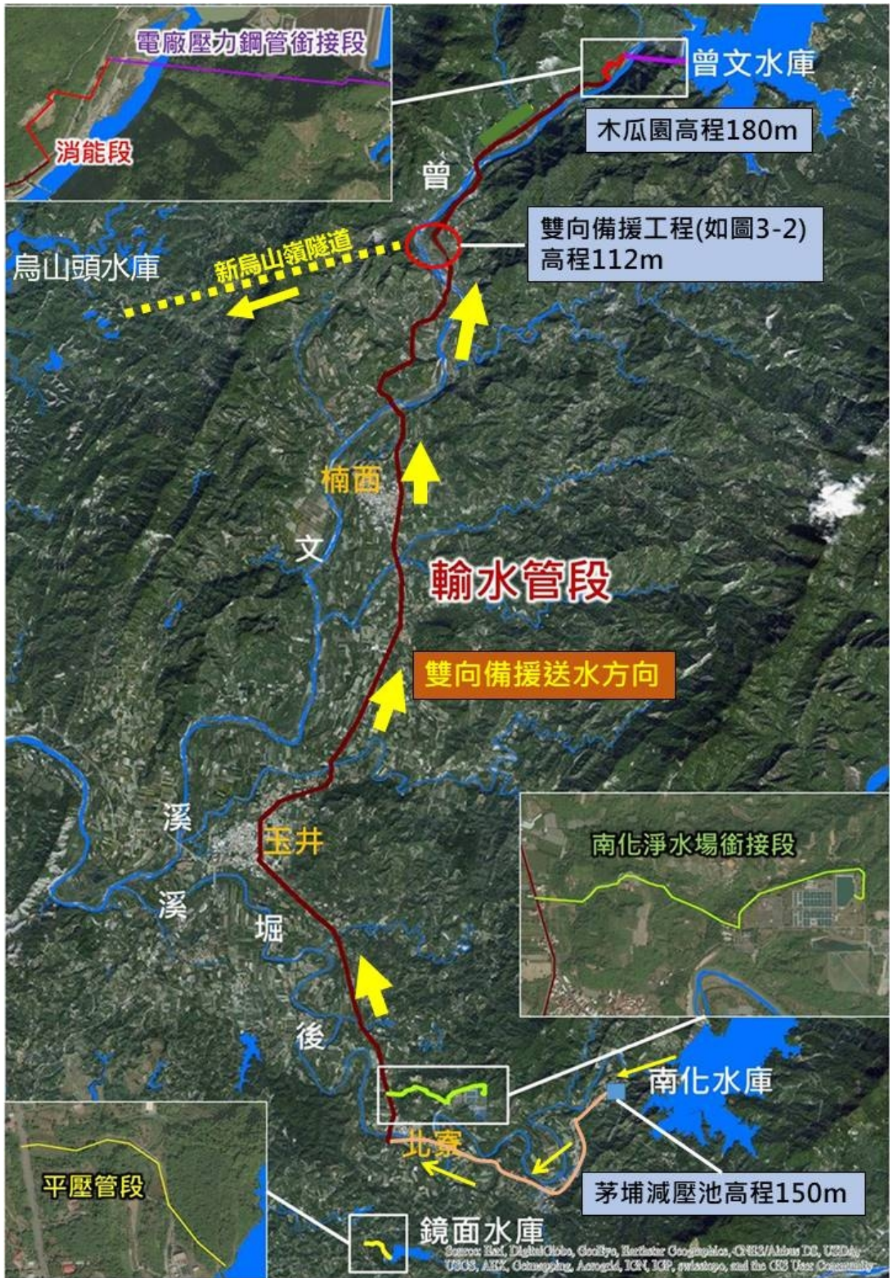
圖 3-1 曾文南化聯通管反(北)送示意圖