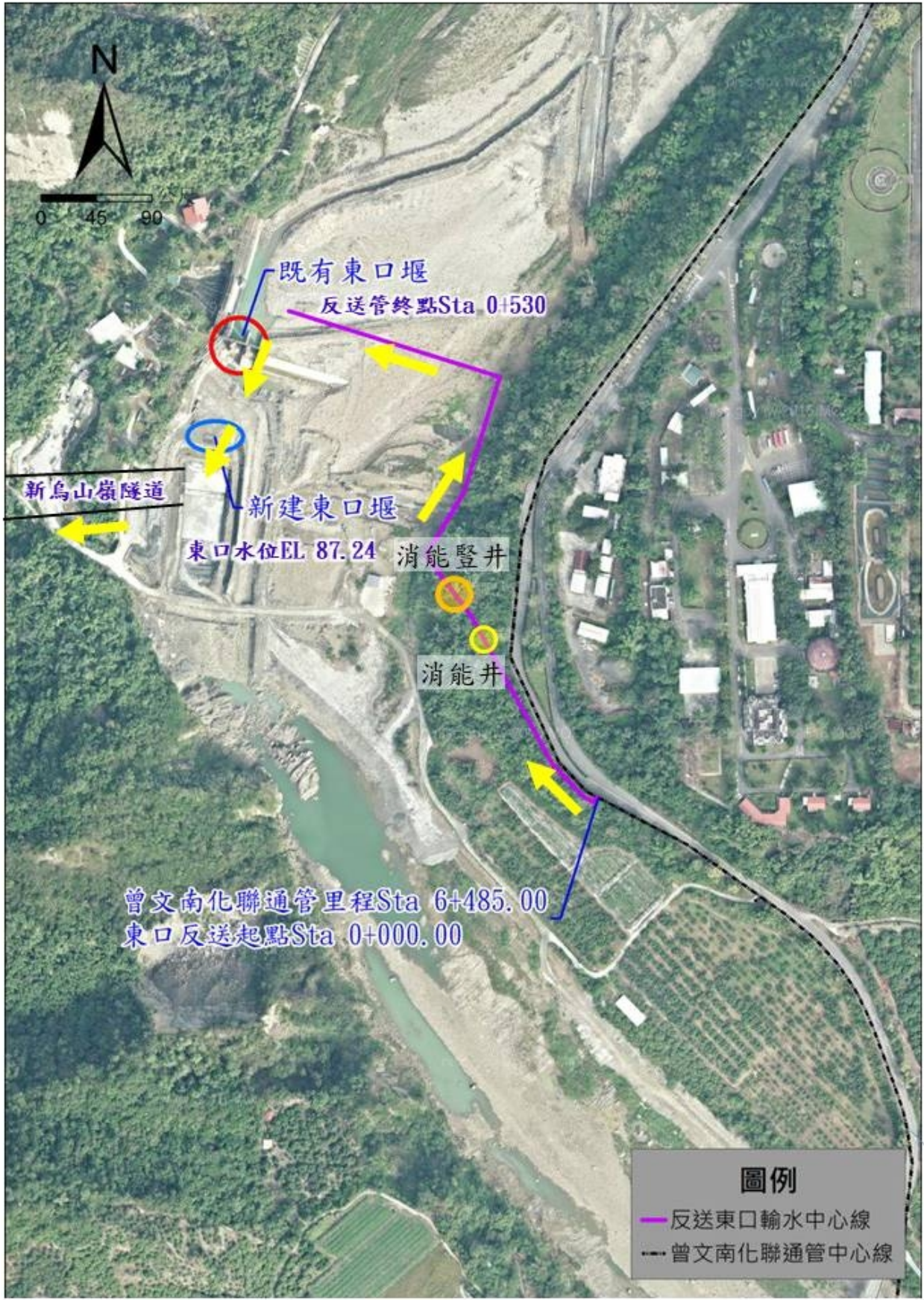
圖 3-2 雙向備援管線反(北)送示意圖