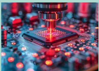
半導體 及其衍生品