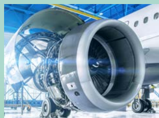
航空零組件的 鋼鋁銅成份