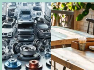
汽車零組件 及木材家俱