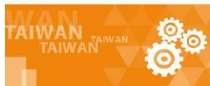
木工機／工具機類別展會