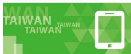
電子資訊類別展會