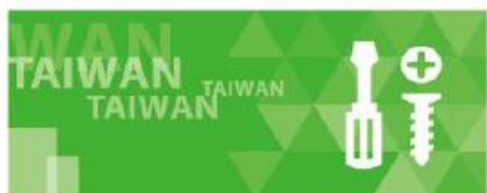
五金零配件類別展會