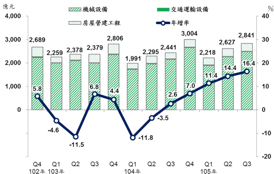
製造業近年各季固定資產增購額及年增率